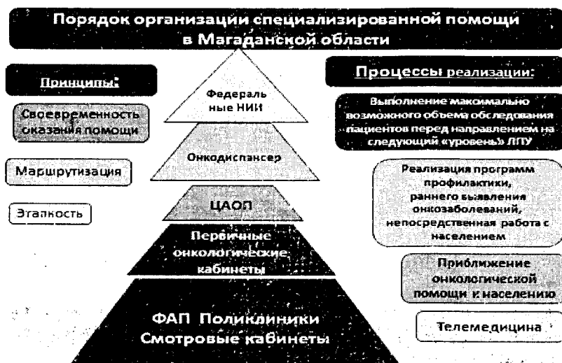
Таблица 1. Врачи-онкологи первичного онкологического кабинета

В медицинских организациях Магаданской области имеются флюорографы, маммографы, функционируют 9 смотровых кабинетов, 70% персонала подготовлены по онкологии. Проводятся профилактические осмотры на выявление онкологической патологии, у женщин берутся мазки из шейки матки на цитологическое исследование.