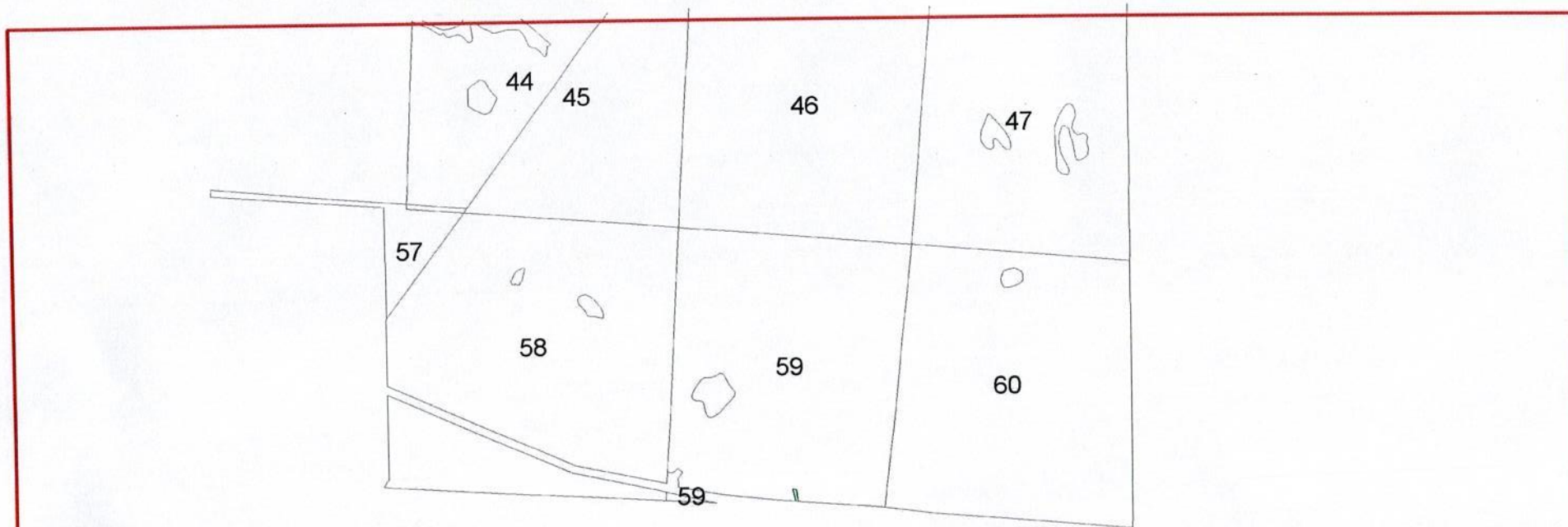
Лист № 1

Приложение № 2 к приказу Рослесхоза от 10.12.2024 № 979