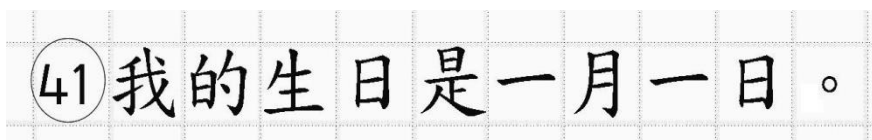
Рис.16. Образец написания иероглифических знаков

Бланк ответов № 2 (лист 1 и лист 2) по китайскому языку (рис. 14 и рис. 15) предназначен для записи ответов на задания КИМ для проведения ЕГЭ с развернутым ответом по китайскому языку (строго в соответствии с требованиями инструкции к КИМ для проведения ЕГЭ и к отдельным заданиям КИМ). Каждый иероглифический знак и каждый знак препинания следует писать внутри отдельной клетки в поле ответов бланка ответов № 2 (дополнительного бланка ответов № 2) (рис. 16).